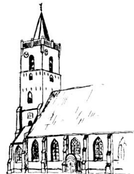
Herv. Gem. Dirksland

Dezelfde week wordt de aangeboden post op de dorpen die zijn aangegeven bezorgd. Doe mee en steun daar- mee de zendingsmedewerkers!